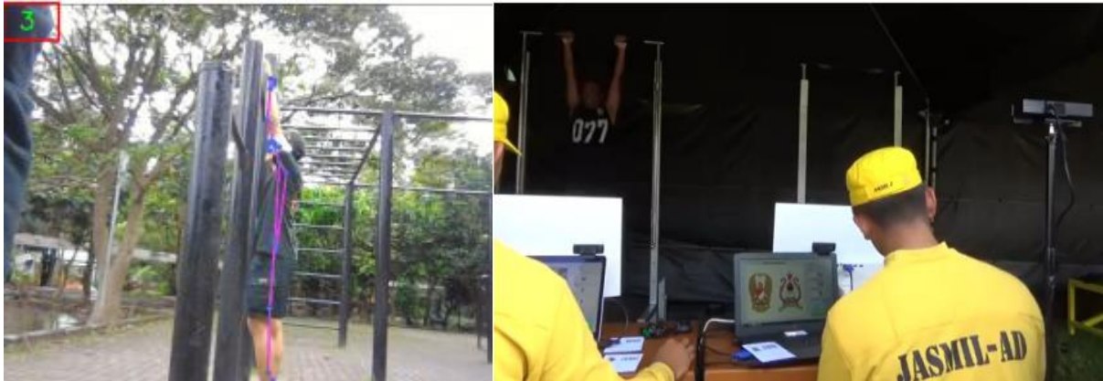
Gambar 1.3 Garjas Elektronik Pull-up – Apel Dansat Kopassus 23 April 2018

Fitur utama dari sistem ini adalah penerapan deep learning dengan algoritma BlazePose untuk mendeteksi gerakan Pull-up secara akurat. Selain itu, sistem ini mampu melakukan perhitungan secara real-time . Kelebihan sistem ini termasuk tidak memerlukan perangkat tambahan seperti Kinect dan dapat digunakan di luar ruangan. Namun, satu kelemahan yang perlu diperhatikan adalah harga perangkat yang relatif tinggi