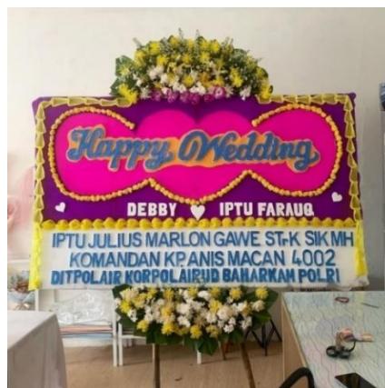
Gambar 1.8 Bunga Papan

Bunga papan adalah sebuah rangkaian bunga dengan menghiasi papan. Biasanya bunga papan digunakan untuk memberikan berbagai ucapan seperti grand opening , wedding atau belangsungkawa. Papan bunga ini dirancang dengan berbagai jenis bunga dan hiasan, menyampaikan pesan