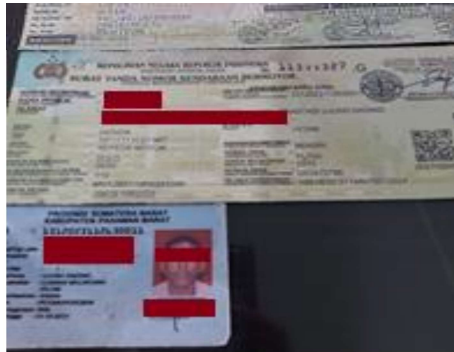
Gambar 1.4 Contoh Kesalahan input nama pada STNK

Pratama Mandiri. Banyaknya konsumen menyatakan sangat puas karena dengan alasan bahwa kepuasan konsumen yang diberikan oleh biro jasa untuk membuat STNK memberikan rasa kepuasan kepada konsumen.