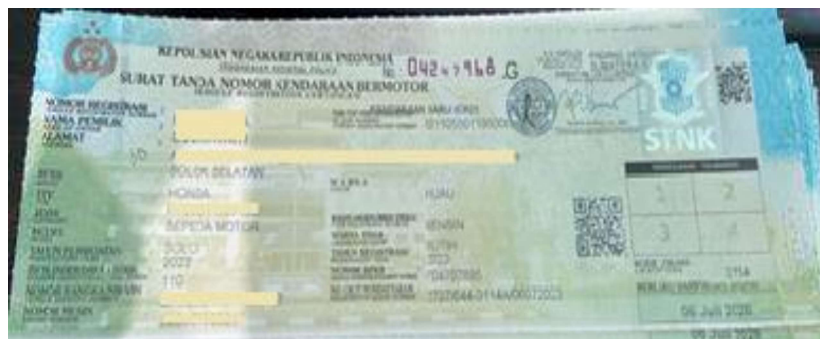
Gambar 1.1 Contoh Surat Tanda Nomor Kendaraan Bermotor (STNK)

Biro jasa STNK ini hanya mengurus dokumen kendaraan konsumen Hayati, tidak bisa merk lain selain Honda. Jadi bukan konsumen yang memilih Biro Jasa Hayati Pratama Mandiri, karena membeli motor di PT. Hayati Prtatama Mandiri mau tidak mau konsumen harus memakai Biro Jasa Hayati Pratama Mandiri sehingga akan membantu pemilik kendaraan sepeda motor Honda dalam proses pembuatan STNK. Sedangkan Biro Jasa yang lainnya yang berada di kota Padang, seperti CV. Jasa Prima Andalas Padang hanya memperpanjang STNK saja.