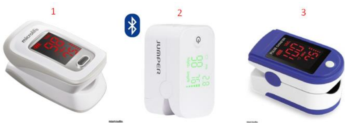
Gambar 1. 2 Alat Pulse Oximeter