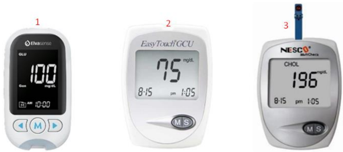
Gambar 1. 1 Alat glukometer