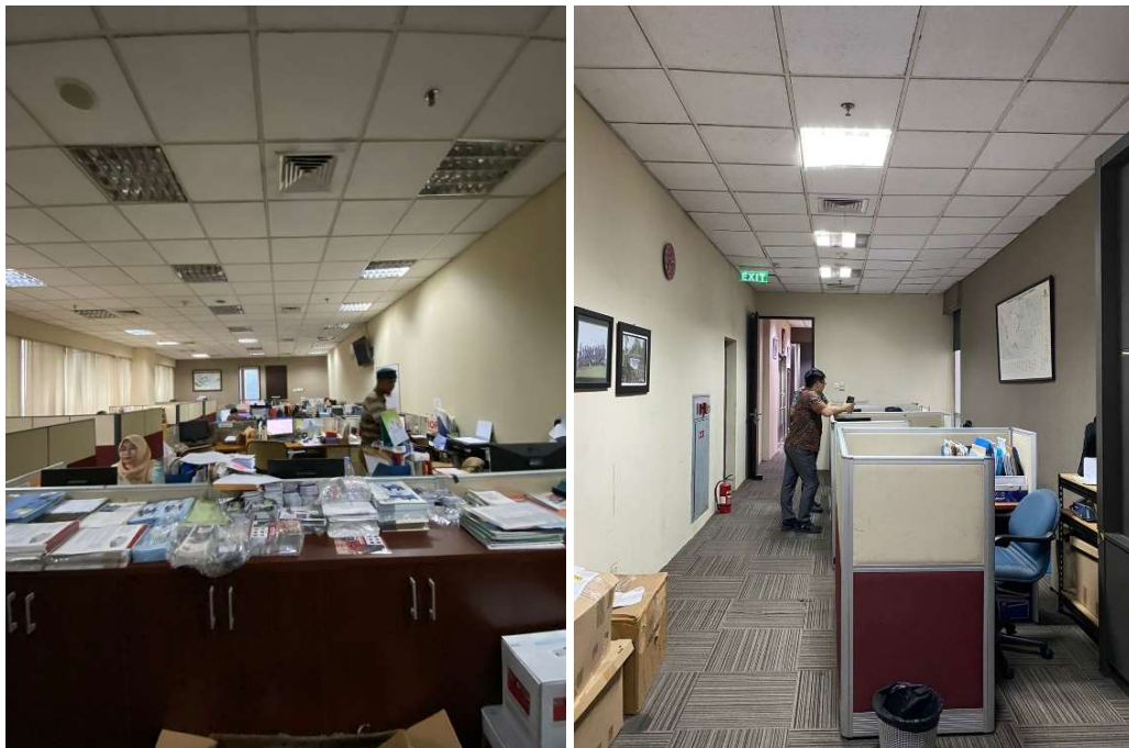
Gambar 1. 3 Suasana Ruang Kantor PT. SOG Indonesia

Lembur yang berlebihan bagaikan racun yang menggerogoti semangat dan produktivitas karyawan. Kelelahan fisik dan mental akibat lembur yang berkepanjangan dapat menurunkan kualitas kerja, meningkatkan risiko kecelakaan kerja, dan bahkan memicu masalah kesehatan yang serius. Di sisi lain, penurunan semangat kerja bagaikan api yang mematikan motivasi dan kreatifitas karyawan. Rasa tidak adil karena harus bekerja lebih keras, ditambah dengan kekhawatiran akan masa depan perusahaan akibat tingginya turnover, dapat membuat karyawan kehilangan fokus, kehilangan gairah, dan kehilangan kepercayaan terhadap organisasi