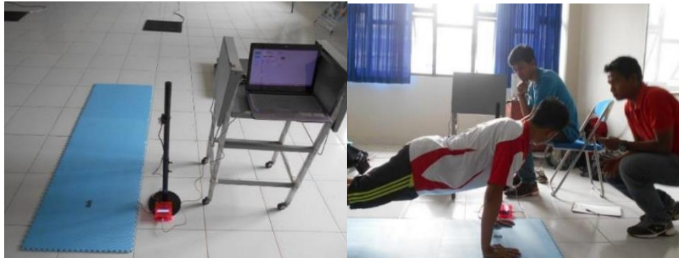
Gambar 1.4 Pengembangan Teknologi Alat Ukur Push-up Berbasis Microcontroller Dengan Sensor Ultrasonik.