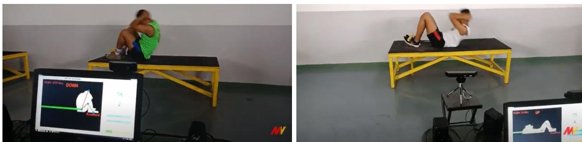
Gambar 1.2 Garjas Elektronik Sit Up – Apel Dansat Kopassus 23 April 2018

Gambar 1.1 menunjukkan perangkat kinect yang digunakan pada sistem Garjas berbasis kinect Xbox. Kinect adalah perangkat input untuk mendeteksi gerakan yang diproduksi oleh Microsoft untuk Video Game XBOX 360 dan PC dengan sistem operasi Windows. Dengan menggunakan kamera yang mirip dengan webcam , memungkinkan Kinect untuk menangkap gerakan pengguna yang akhirnya pengguna tidak perlu menyentuh secara langsung controller game [4].