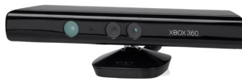
Gambar 1.1 Sistem GARJAS berbasis Kinect Xbox