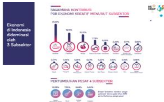
Gambar 1.1 Data Kontribusi PDB Ekonomi Kreatif

Semenjak memasuki tahun 2020 hingga saat ini, produk fashion dari lokal brand di Indonesia sedang mengalami peningkatan yang signifikan. Fenomena yang muncul mengenai brand lokal yang saat ini diminati masyarakat menimbulkan sebuah gerakan dengan tagar #LocalPride yang ada di media sosial. Hal ini menandakan awal dari bangkitnya produk lokal di Indonesia sehingga dapat bersaing dengan produk luar. Perkembangan industri fashion di Indonesia terus bergerak dan memunculkan tren baru, membuat masyarakat tidak ingin ketinggalan dan berlomba untuk selalu tampil up to date (Amri, 2021).