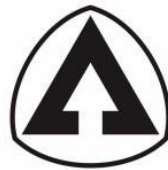
Gambar 1.3 Logo Brand Aerostreet

Aerostreet adalah sebuah brand lokal asal Indonesia yang awal mula berdiri pada tahun 2015 oleh Aditya Caesarico di daerah klaten. Aerostreet berkembang cukup pesat menjadi salah satu brand sepatu lokal yang diminati masyarakat Indonesia karena harga yang relatif terjangkau dengan varian atau edisi catalog yang beragam. Dilansir dalam Bisnis.com, harga sepatu Aerostreet rata-rata dibanderol diangka Rp119.000, bahkan untuk produk sepatu kolaborasi yang limited dan juga viral di media sosial. Sebelum dikenal sebagai sepatu fashion , brand sepatu Aerostreet awalnya dimulai dengan produk sepatu sekolah dengan desain sederhana dengan warna serba hitam. (Farodlilah Muqoddam, 2022).