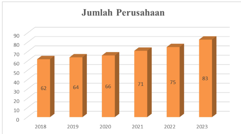
Gambar 1. 1 Perkembangan Jumlah Perusahaan Sektor Energi