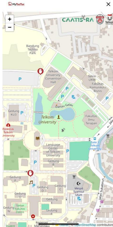
Gambar 1. 2 Aplikasi mytelu

masih belum tersedia. Layanan ini juga tersedia di monitor gedung TULT, namun masih memiliki kekurangan juga karena untuk memonitor bus secara realtime , sopir bus harus mengkonfirmasi dulu agar icon bus yang ada di monitor dapat berjalan, dan layanan tersebut juga belum menampilkan informasi estimasi waktu kedatangan bus ke gedung TULT.