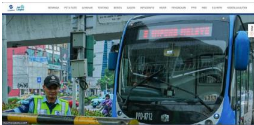
Gambar 1. 1 Website bus transjakarta

Salah satu solusi yang sudah ada yaitu website monitoring bus trans jakarta. Situs web resmi Bus TransJakarta sangat membantu bagi warga Jakarta dan pengunjung kota Jakarta. Pada website tersebut, pengguna bisa dengan mudah cari tahu informasi tentang rute, jadwal, dan peta Bus TransJakarta. Website ini memberikan kemudahan bagi penumpang karena bisa melihat estimasi waktu kedatangan bus di halte. Selain itu, informasi penting seperti tarif, kartu yang bisa digunakan, dan berita terbaru seputar layanan Bus TransJakarta juga ada di situs tersebut. Dengan tata letak yang ramah dan navigasi yang simpel, situs Bus TransJakarta benar-benar bermanfaat untuk memudahkan akses informasi tentang transportasi umum di Jakarta bagi masyarakat yang sering menggunakan layanan Bus TransJakarta. Dibawah ini merupakan website resmi dari bus trans jakarta.