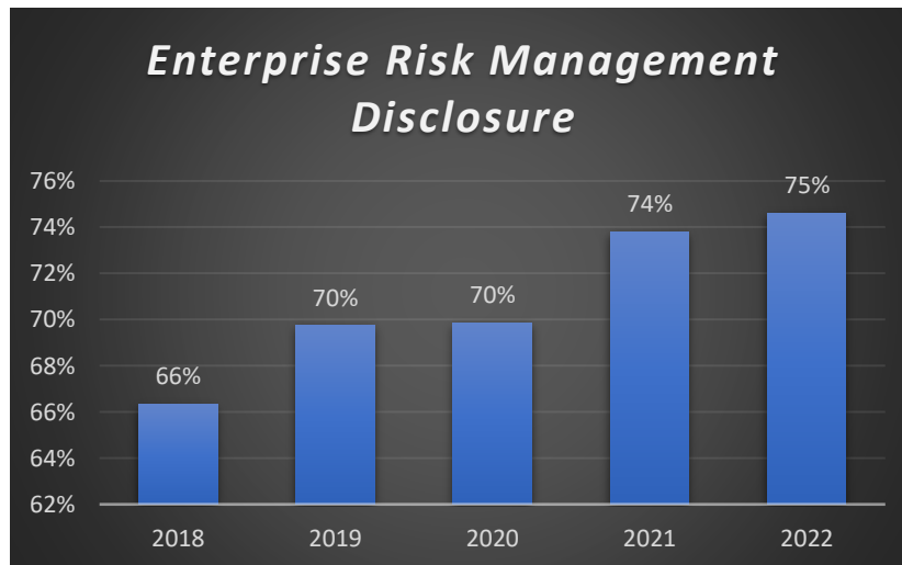
Gambar 1.2 ERMD Perusahaan Asuransi Periode 2018-2022