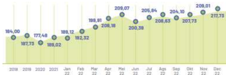
Gambar 1. 2 Grafik pertumbuhan saham perusahaan bank Syariah tahun 2018-2022