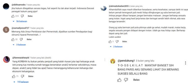
Gambar 1. 5 Komentar di Video Youtube Indonesia Darurat Judi Online

berusia 26 tahun di Kota Pangkalpinang, Bangka Belitung, ditemukan tewas gantung diri di rumahnya karena depresi akibat utang dari judi online (Wahyono, 2024). Kasus ketiga ialah lima karyawan pergudangan di Surabaya ditangkap setelah mencuri peralatan senilai Rp 30 juta untuk dijual dengan tujuan bermain game online , kini mereka menghadapi hukuman maksimal 7 tahun penjara (Setiawan & Hartik, 2023). Kasus terakhir ialah seorang guru honorer berinisial DS di Palangka Raya telah ditangkap setelah menjual handphone ibunya dan menggunakan KTP adiknya untuk mendapatkan modal berjudi online , menyebabkan mereka berurusan dengan hutang pinjaman online (Widyanuratikah, 2024), dan lainnya yang merugikan diri pelaku dan orang sekitar pelaku. Dibalik kerugian pada pelaku dan sekitar pelaku, judi online memiliki positif bersifat pribadi atau personal yaitu sebagai hiburan dikala sedang lelah dan penat terhadap kesibukan sehari-hari (Adli & Jonyanis, 2015). Meskipun demikian, lebih banyak dampak negatif berdasarkan kasus-kasus yang telah dipaparkan ialah orang-orang yang berjudi online sering mengurangi aktivitas fisik mereka, tidak memperhatikan kesehatan, mengabaikan hal-hal penting dalam hidup, kurang bersosialisasi, dan sulit untuk berhenti berjudi (Budiman et al., 2022).