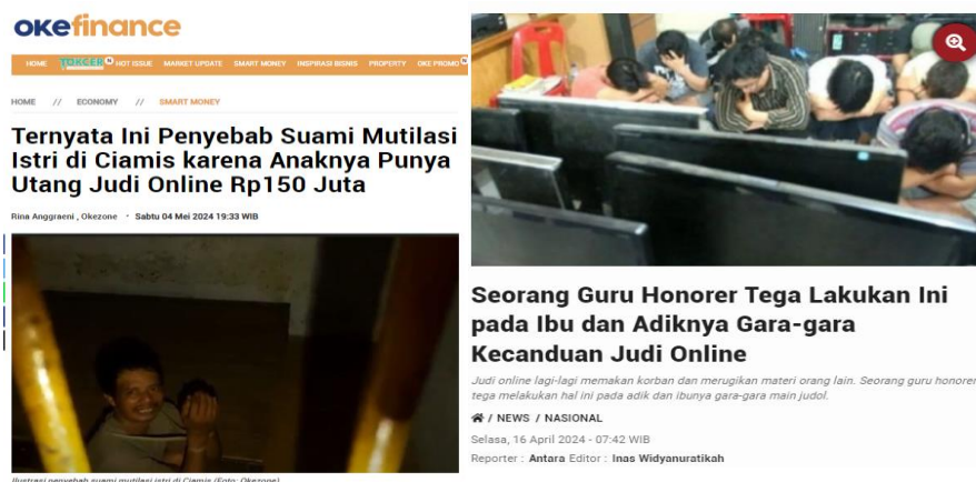
Gambar 1. 4 Berita Dampak Judi Online

Situs judi online menarik pengguna dari berbagai kelompok, usia, dan gender , memungkinkan mereka untuk berpartisipasi dalam perjudian online . Menurut penelitian (Gainsbury, 2015) sebagian besar pengguna situs judi online adalah laki-laki dewasa muda dari berbagai latar belakang sosial dan budaya. Peran status sosial dari berbagai kalangan juga berpartisipasi dalam pemain judi online yang tidak hanya menyasar pada kelas ekonomi tertentu, namun semua kelas ekonomi dapat menjadi pelaku judi online , yang bisa dibedakan hanyalah bentuk permainan dari judi online tersebut (Widiyarti, 2023). Adapun temuan dari (Jiménez-Murcia et al., 2011) yang mengatakan bahwa pelaku judi online memiliki tingkat pendidikan dan status sosial ekonomi lebih tinggi. Hal ini tercermin dalam berita nasional di Indonesia, yang disampaikan oleh Menteri Komunikasi dan Informasi, Budi Arie, yang mencatat bahwa banyak Pegawai Negeri Sipil (PNS) dan Aparat Sipil Negara (ASN) terlibat dalam judi online , khususnya judi slot (Tim 20Detik, 2023).