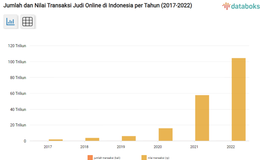
Gambar 1. 2 Jumlah dan Nilai Transaksi Judi Online di Indonesia Sumber: Databoks

mengelaborasi digital (Zulfia, 2023). Adanya digitalisasi dalam dunia perjudian semakin memudahkan masyarakat dalam mengakses platform perjudian online (Pranoto, 2023).