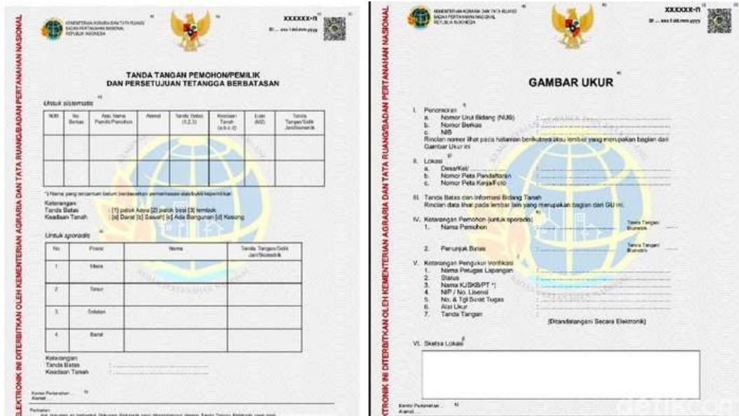
Gambar 1 3 Bentuk Sertifikat Tanah Elektronik