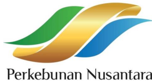
Gambar 1.1 Logo PT Perkebunan Nusantara III