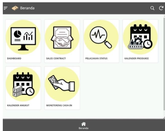
Gambar 1.2 Aplikasi Tea Trae Monitoring