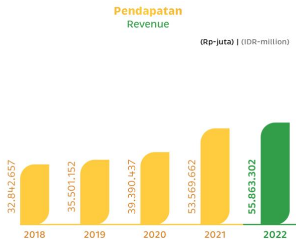
Gambar 1.3 Pendapatan produksi komoditas tahun 2022

Transformasi digital memerlukan akses terhadap data dan bergantung pada aliran informasi, yang dapat terjadi dalam dua arah, dari luar ke dalam dan dari dalam ke luar sebuah perusahaan. Aliran dari luar mengacu pada adopsi proses inovatif dari sistem eksternal,(Böttcher et al., 2022a). Aliran dari dalam memungkinkan informasi yang dihasilkan dalam organisasi digunakan oleh pihak lain, seperti teknologi properti dan pembayaran royalti, (Kringelum et al., 2024a). Transformasi digital memfasilitasi akses ke mitra eksternal, pengalaman, dan pengetahuan, memungkinkan pada saat yang sama untuk menggantikan proses yang sudah lama, meningkatkan sistem yang sudah ada, dan menghindari kerugian (Yılmaz et al., 2024). Transformasi digital dalam pertanian, seperti dalam sektor lainnya, memiliki serangkaian tantangan sendiri, meliputi kurangnya infrastruktur, biaya investasi, kesenjangan digital, regulasi, dan lain-lain,(Silva et al., 2023).