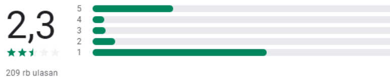
Gambar 1.6 Peringkat Penilaian KAI Access di Google Play

Peringkat rendah banyak diberikan oleh pengguna KAI Access disebabkan masih banyaknya kendala yang dirasakan dalam menggunakan aplikasi. Kendala yang umumnya terjadi ketika proses pembelian tiket seperti terdapat jadwal kosong, kesulitan proses pembayaran, proses memuat yang lama dan error.