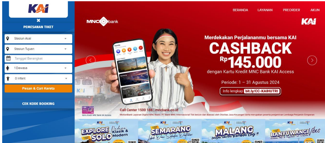
Gambar 1.3 Tampilan Website Booking KAI

(GSM) dan melakukan pemesanan tiket H-90 hari hingga 24 jam sebelum keberangkatan.