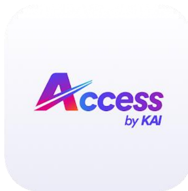
Gambar 1.2 Logo KAI Access

PT Kereta Api Indonesia (KAI) merupakan satu-satunya Badan Usaha Milik Negara (BUMN) di bawah lingkup Departemen Perhubungan yang bergerak di bidang jasa perkeretaapian. Seiring dengan bertambahnya aktivitas masyarakat dan persaingan dalam bisnis transportasi darat, PT KAI terus melakukan inovasi hingga memiliki salah satu produk unggulan yaitu aplikasi mobile KAI Access . Bersamaan dengan perkembangan teknologi mobile, aplikasi mobile juga mengalami pertambahan. Kereta Api Indonesia (KAI) Access ini sendiri adalah sebuah aplikasi mobile resmi yang diluncurkan oleh PT Kereta Api Indonesia untuk memudahkan calon penumpang untuk mendapatkan informasi dan juga melakukan pemesanan tiket kereta api secara daring. KAI Access merupakan teknologi informasi yang tergolong baru yang mana baru saja diluncurkan pada tahun 2014.