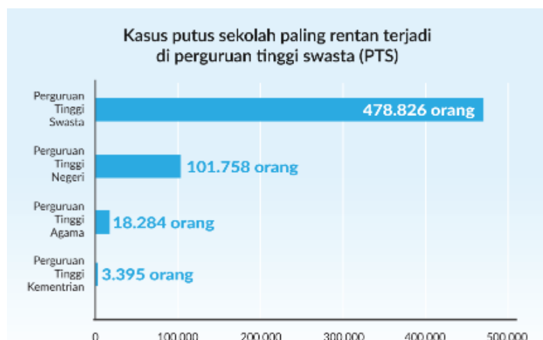
Gambar I.1 Jumlah drop out pada tahun 2020

Berdasarkan data yang diperoleh dari opedata.jabar.go.id pada tahun 2020 terdapat 8.483.213 mahasiswa yang terdaftar sebagai mahasiswa, namun dari jumlah mahasiswa yang terdaftar 602.208 mahasiswa memutuskan untuk berhenti kuliah yang dimana dari angka tersebut mayoritasnya berasal dari perguruan tinggi swasta dengan angka sebanyak 478.826 mahasiswa atau 79,5% dari total kasus mahasiswa yang berhenti kuliah, kemudian dari perguruan tinggi negeri (PTN) sebanyak 101.758 orang, 18.284 orang dari perguruan tinggi agama (PTA) dan sisanya 3.395 orang dari perguruan tinggi kedinasan (PTK). Pada Gambar I.1 menunjukkan tingkat kasus berhenti kuliah yang terjadi pada tahun 2020 yang dikutip dari opedata.jabarprov.