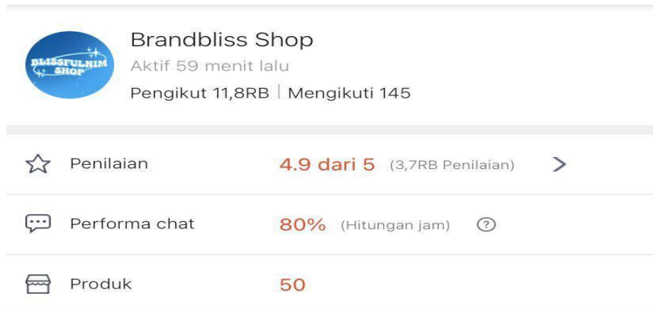
Gambar 1.5 Penilaian Ulasan Pelanggan