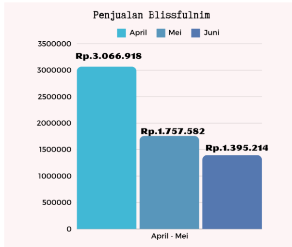
Gambar 1.6 Penjualan Blissfulnim April – Mei