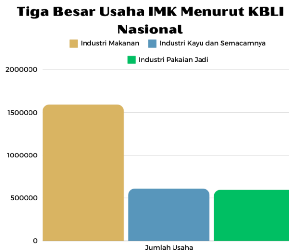
Gambar 1.2 Tiga Besar Usaha IMK Menurut KBLI Nasional