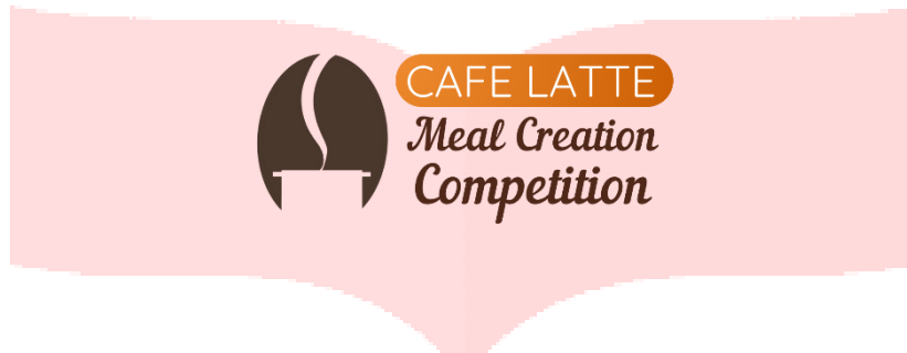
Gambar 1 Logo event

Logo event menggabungkan dua elemen bentuk dari kopi, panci dan asap. Pada bagian bawah biji kopi di potong menyerupai siluet bentuk panci. Kemudian pada bagian tengah kopi dibentuk lengkungan yang dapat menyerupai asap dari panci atau bentuk garis pada bagian tengah kopi. Penggunaan elemen kopi dan panci dimaksudkan untuk memberitahukan target audiens gambaran dari event Cafe Latte Meal Creation Competition, yaitu tentang masakan atau makanan dan juga kopi.