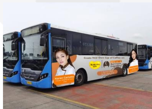
Gambar 10 Bus Stiker Ads

Penggunaan stiker klan pada bus masuk kepada ambient media. Pesan yang ditampilkan pada bus bermaksud untuk mengajak masyarakat untuk membuat kreasi makanan dari segelas kopi.