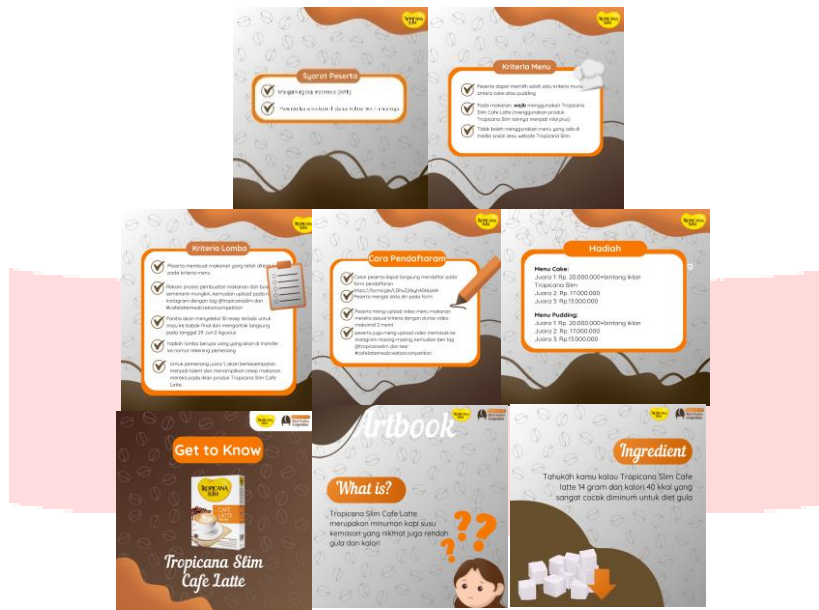
Gambar 11 Instagram Feed

Pada tahapan selanjutnya yaitu search menampilkan detail informasi mengenai event . Media yang digunakan pada tahap ini yaitu website dan Instagram Feed. Instagram feed menampilkan teknis, cara daftar pendaftaran dan juga informasi mengenai produk Tropicana Slim Café Latte.