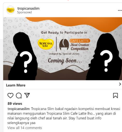
Gambar 6 Instagram Ads

Pengguna media sosial Instagram dapat melihat iklan yang ditampilkan Tropicana Slim mengenai teaser event Tropicana Slim yang akan segera hadir dan juga menampilkan foto juri yang menjadi misteri.