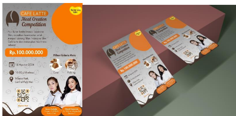
Gambar 9 Flyer

Selanjutnya media flyer ditempatkan di toko swalayan atau supermarket, dimana pembeli akan mendapatkan flyer di setiap pembelian mereka di kasir toko. Flyer berisi ajakan mengikuti event, informasi mengenai tanggal, tempat, hadiah, juri, dan barcode pendaftaran.