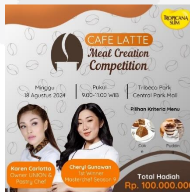
Gambar7 Instagram Feed

Pada tahapan Interest, menampilkan event yang akan digelar oleh Tropicana Slim lewat social media, media cetak, dan ambient media, diantaranya adalah media Instagram feed , flyer , poster, dan bus stiker ads . Media Instagram feed menampilkan poster acara Café Latte Meal Creation Competition yang digelar pada tanggal 18 Agustus, tempat pelaksanaan dan jam dimulai event .