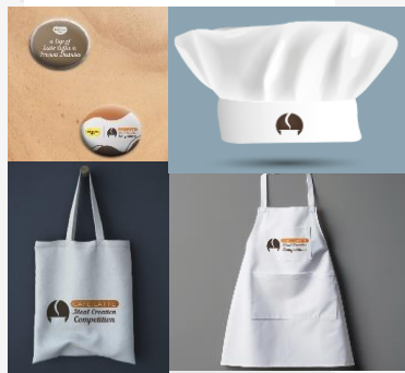
Gambar 14 Merchandise

Tahap terakhir merupakan share , dimana pada tahap ini menggunakan 2 media yaitu merchandise dan sosial media Instagram story. Peserta lomba akan mendapatkan merchandise berupa apron, totebag, topi, dan pin bros yang akan dibagikan sebelum acara dimulai. Sedangkan pengunjung beserta penonton dapat membeli produk Tropicana Slim Café Latte yang ada di booth dan mendapatkan goody bag dan paper cup saat pembelian minuman di booth . Sedangkan media sosial seperti Instagram Story akan digunakan oleh pengunjung dan berisi tentang kegiatan mereka di event Café Latte Meal Creation Competition pada akun media sosial mereka masing-masing.