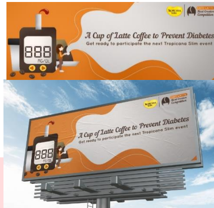
Gambar 5 Billboard

Selanjutnya media Billboard digunakan untuk menyampaikan pesan berupa awareness terhadap produk kopi Tropicana Slim dan juga diabetes.