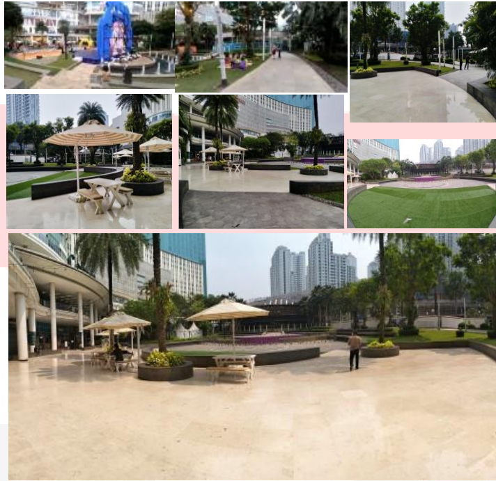
Gambar 3 Foto Tribeca Park

Pelaksanaan event kompetisi memasak Tropicana Slim dilaksanakan pada hari Minggu, tanggal 18 Agustus 2024 dengan nama event “Café Latte Meal Creation Competition!” diikuti oleh 18 peserta yang telah terpilih lewat seleksi online . Pada kompetisi memasak ini, peserta ditantang untuk membuat kreasi makanan berupa kue atau pudding menggunakan produk Tropicana Slim Café Latte. Event diadakan outdoor tepatnya di Tribeca Park, Central Park Mall, Jakarta Barat. Alasan pemilihan lokasi, dikarenakan lokasi mall yang strategis berada di kawasan perkantoran dan apartemen serta dekat dengan pusat perbelanjaan.