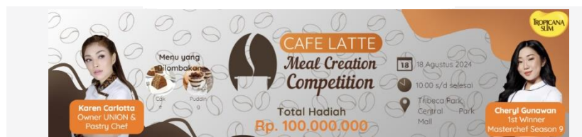
Gambar 12 Website