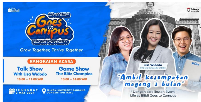
Gambar 2. Desain Billboard