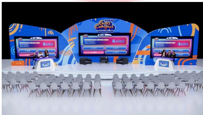
Gambar 6. Desain Stage saat Game Show

3.5 Share, Terdapat booth yang menyediakan berbagai macam merchandise dan photobooth. Untuk mendapatkan merchandise, peserta harus terlebih dahulu berfoto di photobooth dengan photoframe maskot Life at Blibli Goes To Campus yang telah disediakan.