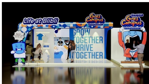
Gambar 7. Desain Stage saat Game Show

3.5 Share, Terdapat booth yang menyediakan berbagai macam merchandise dan photobooth. Untuk mendapatkan merchandise, peserta harus terlebih dahulu berfoto di photobooth dengan photoframe maskot Life at Blibli Goes To Campus yang telah disediakan.