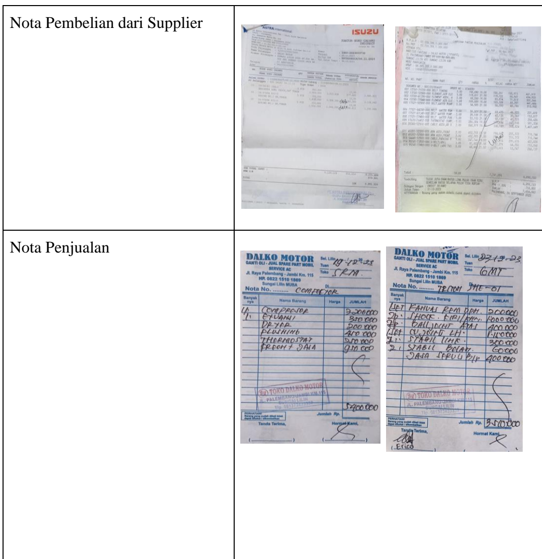
Tabel I. 1 Nota Pembelian dan Penjualan

Berikut adalah bukti pembelian dan faktur penjualan yang digunakan oleh bengkel Dalko Motor untuk mencatat barang yang diterima dan dijual.