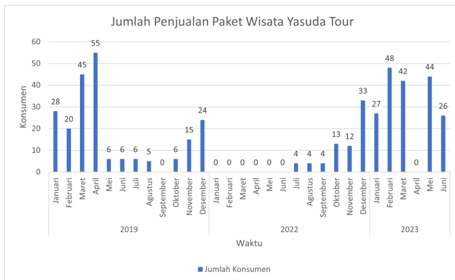
Gambar I.2 Penjualan Paket Wisata Yasuda Tour

Salah satu perusahaan penyedia jasa perjalanan yang mengalami peningkatan perjalanan wisata adalah CV. Yasuda Jaya Tour yang telah berdiri dari tahun 2008 di daerah Tegal, Jawa Tengah. Peningkatan perjalanan wisata pada perusahaan ini dibuktikan dengan data penjualan paket wisata pada tahun 2019, 2022, dan 2023. Pada Gambar I.2, dipaparkan data penjualan paket wisata Yasuda Tour.