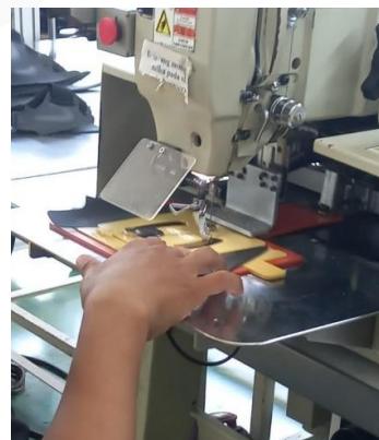
GAMBAR 3 Proses Pemasangan Mold

Pada proses penempelan pada mold, operator belajar melakukan bagaimana cara memosisikan mold harus tepat berada dibawah jarum jahit saat penempelan pada komputer yang baik dan benar agar posisi mold tidak berubah pada saat proses penjahitan.