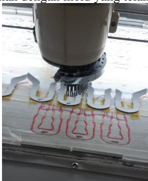
GAMBAR 4 Penempelan Bahan Dengan Pola

Pada penempelan bahan pada pola disini operator diajarkan bagaimana cara saat penempelan yang sesuai dengan standar yaitu berjarak 2 cm dari jalan tepi pinggir bahan material. Berikut ini merupakan penempelan bahan dengan mold yang telah sesuai.