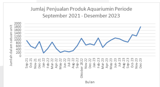
Gambar 1 Jumlah Penjualan Aquariumin

Aquariumin adalah usaha yang menawarkan produk aquascape seperti batu, pasir, kayu, dan tanaman air serta layanan pembuatan proyek aquascape untuk berbagai lokasi. Aquariumin berdiri sejak 2021. Aquariumin menarik konsumen dengan paket aquascape yang dilengkapi video tutorial pemasangan. Gambar 1 menunjukkan grafik penjualan Aquariumin yang mengalami fluktuasi di beberapa bulan dengan tren kenaikan tahunan rata-rata penjualan sebesar 1814 unit per bulan dari September 2021 hingga Desember 2023. Pemilik menganggap perlunya peningkatan penjualan, salah satunya dengan membuka toko offline , dan pernyataan tersebut juga didukung dengan hasil kuesioner yang dibagikan terhadap pelanggan Aquariumin yang hasilnya terdapat pada gambar 2.