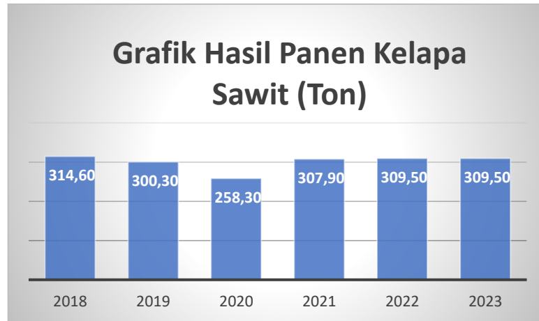
Gambar I. 6 Hasil Panen Pemilik Lahan

kerjasama antara petani dan ram kelapa sawit maka seluruh hasil panen kelapa sawit akan terjual dengan mudah, tanpa harus mencari lagi pembeli yang ingin membeli hasil panen dari petani.