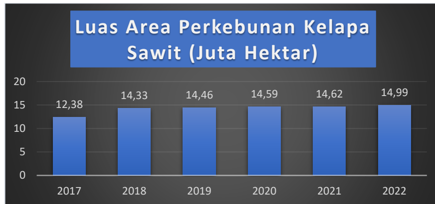
Gambar I. 2 Luas Area Perkebunan Kelapa Sawit

lagi, Indonesia merupakan salah satu penghasil komoditas kelapa sawit terbesar di dunia. Kementerian Pertanian mengeluarkan data termutakhir luas perkebunan kelapa sawit di Indonesia mencapai 14,99 juta hektare (ha) pada 2022. Jumlah itu meningkat 2,49% dibandingkan pada tahun sebelumnya yang seluas 14,62 juta ha. (bpdp.or.id, 2022).