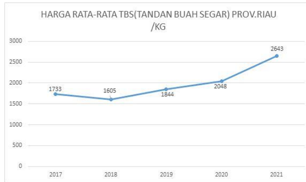
Gambar I. 5 Harga Rata-Rata TBS Prov. Riau