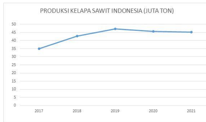
Gambar I. 3 Produksi Kelapa Sawit

Badan Pusat Statistik (BPS) mencatat, Indonesia memproduksi kelapa sawit sebanyak 45,12 juta ton pada 2021. Jumlah tersebut mengalami penurunan 1,02% dibandingkan pada tahun sebelumnya yang mencapai 44,74 juta ton. Melihat trennya produksi kelapa sawit Indonesia menunjukkan tren meningkat. Rekor produksi terbanyak dalam satu dekade terakhir mencapai 47,12 juta ton pada 2019. Secara rinci, kelapa sawit yang berasal dari perkebunan besar sebanyak 30,06 juta ton pada 2021. Sementara, 15,52 juta ton kelapa sawit berasal dari perkebunan milik rakyat (dataindonesia.id,2023).