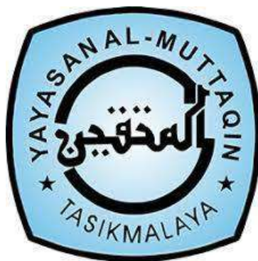
Gambar 1. 1 Logo LPI Yayasan Al-Muttaqin

Selain fokus pada Lembaga Pendidikan Islam (LPI), yayasan jua mendukung lembaga lain seperti Lembaga Ekonomi Islam (LEI), Lembaga Kesehatan, Lembaga Sosial Islam (LSI) dan Lembaga Dakwah Islam (LDI). LPI Yayasan Al-muttaqin ini juga mengelola organisasi dan pesantren. Salah satu keunggulan pendidikan yang diberikan LPI Yayasan Al-Muttaqin khususnya pada tingkat SD, SMP, dan SMA adalah diterapkannya sistem KBM (kegiatan belajar mengajar) dengan pola “ Full day school ”. Pendekatan ini bertujuan untuk membekali peserta didik dengan pendidikan yang komprehensif dan menciptakan generasi umat yang beriman dan bertakwa yang menguasai ilmu pengetahuan yang beriman dan bertakwa, menguasai ilmu pengetahuan dan teknologi serta menjadi generasi ulul albab. Berikut logo dari Yayasan LPI Al-Muttaqin.