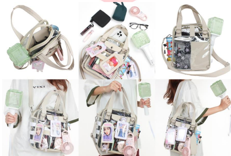
Gambar 4 Hasil Produk Sumber : Dokumentasi Pribadi, (2024)