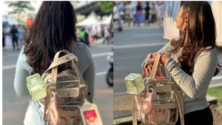
Gambar 5 Uji Coba Produk oleh Pengguna Sumber : Dokumentasi Pribadi, (2024)

Berdasarkan uji coba produk yang telah dilakukan, hasil validasi yang telah didapatkan dari staff penyelenggara konser K-Pop dan pengguna, sebagai berikut :