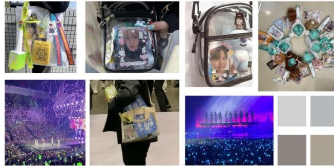
Gambar 1 Moodboard