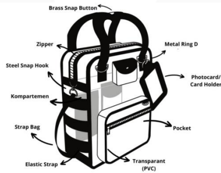
Gambar 2 Sketsa Desain Final