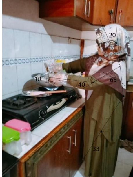
Gambar I. 3 Perhitungan Postur Tubuh Pekerja

lebih dari satu kali dalam sehari. Hasil wawancara ini diperkuat dengan perhitungan Rapid Entire Body Assessment (REBA) pada kegiatan mengaduk yang ditampilkan pada Gambar 1.3.