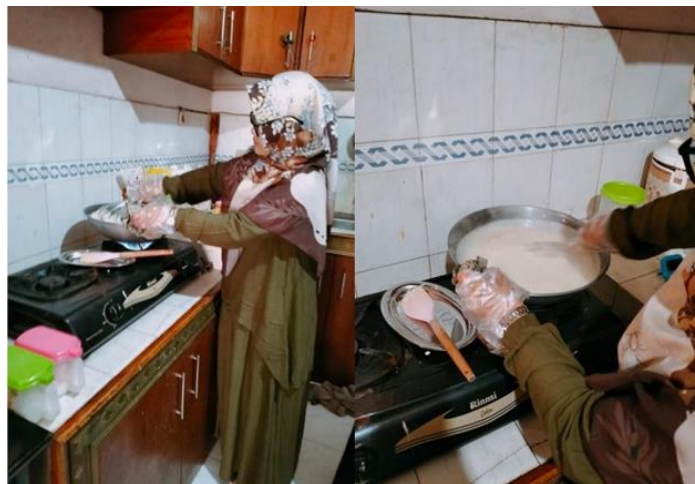
Gambar I. 2 Proses pengadukan

UMKM Schotel Van Java adalah salah satu usaha mikro, kecil, dan menengah (UMKM) di Kabupaten Bandung yang berdiri sejak tahun 2015. Salah satu produk unggulan yang diproduksi oleh UMKM Schotel Van Java adalah macaroni schotel . Sebagai ciri khas dari macaroni schotel , terdapat bahan yang harus diproduksi, yaitu saus. Proses pembuatan saus memakan waktu sekitar 25 menit dan masih dilakukan secara manual. Pembuatan saus dimulai dengan penggunaan wajan, lalu dilakukan pengadukan selama 25 menit oleh operator menggunakan api besar. Proses pengadukan ini tidak boleh berhenti, karena jika pengadukan saus berhenti, saus dapat menjadi gosong dan pembuatan saus akan gagal. Berikut merupakan proses pengadukan pada UMKM Schotel Van Java yang ditampilkan pada Gambar 1.2.