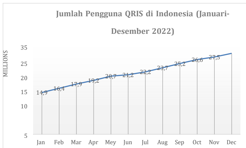
Gambar 1.1 Pengguna QRIS di Indonesia (Januari–Desember 2022)

Pengguna QRIS di Indonesia mencapai 26,7 juta pada penjual pada Juni 2023, 91,4% nya pengguna UMKM. Sejalan dengan perkembangan itu, transaksi di QRIS selama tahun 2022 sudah mencapai sebesar 1,03 miliar transaksi atau setara dengan 86% [7]. Terdapat gambar 1 data yang menunjukkan jumlah Masyarakat di Indonesia yang menggunakan QRIS sebagai alat pembayaran [8].