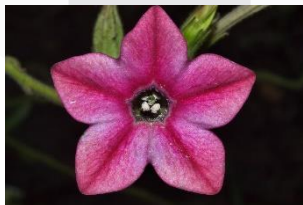
Gambar 1 Contoh Gambar asset Mapping

Pada tahap Pra – Produksi penulis juga menyiapkan beberapa elemen asset digital yang digunakan untuk mapping pada proyektor