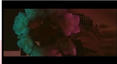
Gambar 7 Teknik Data Mosh

Data Mosh merupakan sebuah Teknik editing yang akan merusak video menjadi pecah pecah, Teknik ini digunakan sebagai konsep visual untuk merepresentasikan androgini. Data Mosh digunakan sebagai pengartian salah paham Masyarakat terhadap androgini.