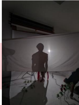
Gambar 11 Teknik Siluet

Teknik siluet dalam film adalah metode visual yang memanfaatkan bayangan untuk menciptakan efek dramatis atau artistik. Siluet adalah gambar yang menampilkan bentuk atau kontur objek tanpa detail internal, biasanya dengan latar belakang yang terang sehingga objek terlihat gelap. Teknik ini dipakai untuk menggambarkan kedua Gerakan tarian laki laki serta perempuan secara bergantian, namun tidak terlihat apakah yang menari merupakan seorang Perempuan atau laki laki