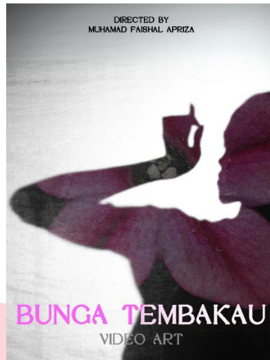
Gambar 12: Poster karya

Link Karya: https://youtu.be/Kph6qZ4YAyU