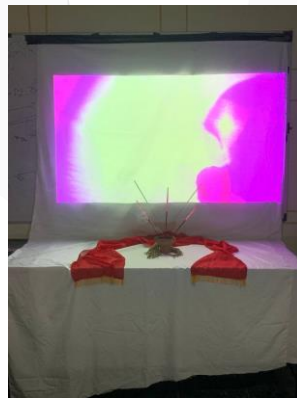
Gambar 1: Contoh Instalasi

Pada karya ini, penulis menampilkan karya video art dengan karya sebagai instalasi, sebagai pelengkap video art tersebut agar suasana, serta emosi didapatkan oleh penonton, penulis menggunakan kain putih sebagai layar, serta proyektor untuk memproyeksikan video art tersebut, ditambah ornamen ornamen pendukung video art seperti bunga, kain penari serta dupa yang dibakar.