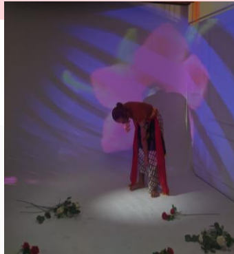
Gambar 10 Video Mapping

Di era modern ini, teknologi telah membuka pintu bagi seniman untuk mengekspresikan kreativitas mereka melalui sarana yang baru. Sebagaimana yang disebutkan oleh Soetedja (2011), seni saat ini tidak lagi terbatas pada media tradisional, melainkan telah merambah ke dalam teknologi, media komunikasi, dan informasi. Jenis-jenis seni yang berkaitan dengan media baru tersebut, seperti seni internet (web art), pertunjukan video, seni video (video art), seni seluler, telah menjadi salah satu bentuk seni yang diminati dan menjadi ciri khas dari seni modern. Dengan adanya teknologi, seniman memiliki akses yang lebih luas untuk menyampaikan pesan dan karya seni mereka kepada khalayak dengan cara yang lebih inovatif dan modern (Yuningsih, C. R., & Rachmawanti, R. 2022).