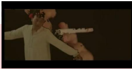
Gambar 4: Penari Laki - Laki

Penari laki laki digunakan sebagai konsep visual sebagai representasi dari androgini. Penari laki laki juga dipilih karena mempunyai karakter yang kuat terhadap androgini.