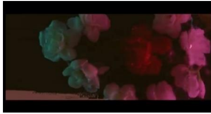
Gambar 9 Teknik Data Mosh

Simbol bunga digunakan juga untuk menunjukkan simbol gender, simbol bunga digunakan dalam konsep visual yang menggambarkan representasi androgini.