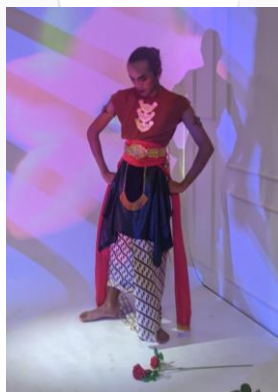
Gambar 6 Wardrobe dari tari puja

Pada Penggunaan wardrobe tari puja. Penulis mengkreasikan dengan menggunakan pakaian khas tari jaipong, ditambah dengan ornament pelengkap seperti sampur/selendang. Tata rias yang digunakan juga merupakan tata rias dari