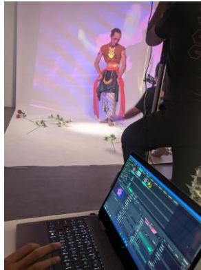
Gambar 3 Proses Produksi