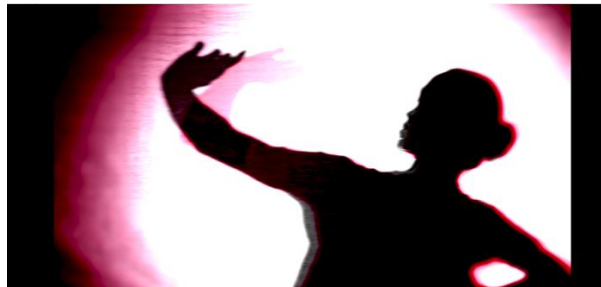
Gambar 2: Gerakan "Nyawang" Tari Puja

yang putih menjadi bagian Pada karya ini, sehingga ketika karya ini ditampilkan maka set yang ditampilkan seperti gambar yang ada. Pada karya ini juga menampilkan beberapa gerakan tari yang menjadi representasi dari androgini.