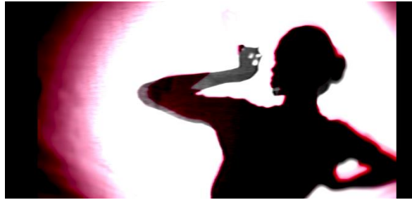
Gambar 4: Siluet seperti wayang

Dalam setiap scene yang ada, penulis lebih banyak menampilkan siluet seperti wayang dengan dua gerakan yaitu kaku dan lemah lembut, ditampilkannya scene siluet seperti wayang akan membuat orang yang menonton tidak mengira bahwa orang yang menari dengan lemah lembut tersebut merupakan seorang laki laki. Penulis juga menambahkan sebuah karangan “Pupuh Jurumendung” yang mengandung arti dua Keputusan yang berat dihadapi, dalam pupuh tersebut juga menjelaskan hal yang baik dan buruk perilaku seseorang.