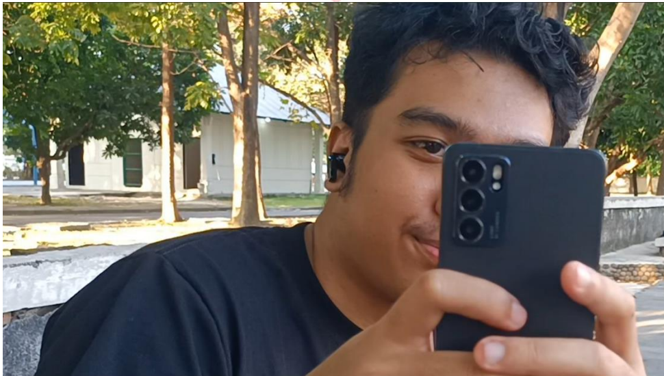
Gambar 3.12 Bentuk adegan perekaman 2

Adegan ini diambil di salah satu perempatan jalan sekaligus palang kereta api di daerah Solo. Dalam proses pengambilan gambar dalam adegan ini sudah dengan izin kepada yang bersangkutan. Pada saat pengambilan gambar ini, terdapat kendala dalam waktu. Penulis mencari waktu yang tepat ketika jalanan mulai ramai dan juga subjek yang bersangkutan mulai bergerak mengatur lalu lintas.