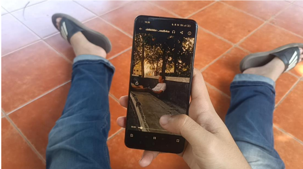
Gambar 3.13 Bentuk adegan menonton hasil rekaman tanpa izin

tertidur di suatu tempat. Lalu, mahasiswa tersebut merekamnya kembali karena menurutnya bisa dijadikan sebuah cerita dan dia simpan untuk kenang – kenangan video lucu di handphone nya yang sewaktu – waktu ia bisa tonton kembali.