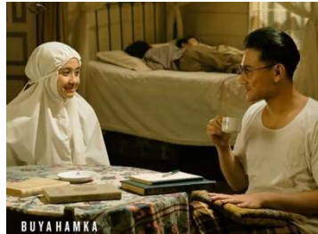
Gambar 2.2. Contoh Cuplikan Film Buya Hamka

keberhasilannya dalam mengeksplorasi dan menggambarkan aspek-aspek budaya Minangkabau, tetapi juga dalam penyajian cerita yang menarik dan mendalam. Dengan berhasilnya film ini di box office , menunjukkan bahwa tidak hanya penonton dari Minangkabau, tetapi juga penonton dari berbagai latar belakang budaya di Indonesia tertarik dan mengapresiasi cerita yang diangkat. Kesuksesan "Buya Hamka" di box office juga dapat menjadi inspirasi bagi penulis dalam mengambil langkah-langkah yang tepat dalam merancang dan memproduksi film. Dengan mengetahui bahwa film dengan tema budaya lokal dapat sukses di pasar film Indonesia, penulis dapat lebih percaya diri dalam menggarap proyek ini dan berharap untuk mencapai kesuksesan serupa.