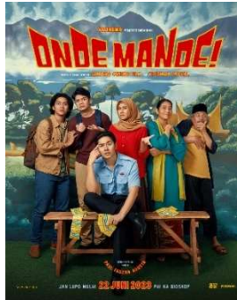
Gambar 2.4. Film Onde Mande

Dalam Film Eksperimental. berfokus pada isu budaya Minangkabau, film "Onde Mande" menjadi titik awal yang penting. Dengan mempertimbangkan aspek-aspek budaya Minangkabau yang telah dieksplorasi dalam "Onde Mande", penulis dapat melihat potensi untuk melanjutkan eksplorasi tersebut dengan fokus pada aspek-aspek lain yang belum tergarap sepenuhnya.