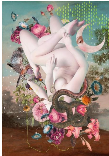
Gambar 1. 2 Entropy, Alexandre Gallagher (2023)

Salah satu seniman yang mengangkat isu tentang feminisme adalah Alexandra Gallagher, lahir di Inggris pada tahun 1980. Subyek inspirasi dari karya Alexandra ini adalah bagaimana dia mengeksplorasi alam bawah sadar, mimpi, ingatan dan imajinasi yang berfokus pada subyek perempuan. Alexandra mengangkat isu feminisme, identitas dan seksualitas yang digambarkan melalui simbol-simbol stereotip feminitas yang mengajak penonton untuk mempertanyakan peran tradisional perempuan dalam masyarakat. Karyanya berjudul “ Entropy ” ini membahas tentang segala sesuatu atau kecenderungan semua sistem sedang menuju ke arah ketidakteraturan yang ditinggikan. Dalam karya tersebut, Alexandra ini para penikmatnya melihat bagaimana tatanan kehidupan perempuan menuju kehancurannya.