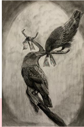
Gambar 4. Sketsa dan Prototype

A1 (59,4 x 84,1 cm) Dibawah ini merupakan sketsa kasar dari konsep atau ide penciptaan karya yang ingin dibuat.