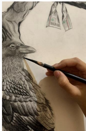
Gambar 13. Proses Menambahkan Detail

Selanjutnya menambahkan detail – detail yang dibutuhkan dalam karya.