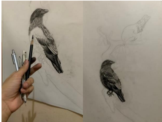
Gambar 11. Tahap Penggambaran Shadow

Selanjutnya nya, mulai tambahkan shadow atau bayangan pada bagian – bagian yang diperlukan, pada tahap ini penulis menggunakan compressed charcoal dan pencil charcoal dengan tipe dark , untuk digunakan pada bagian area yang gelap.