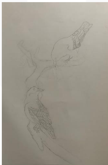
Gambar 10. Sketsa dan Outline Karya

Dimulai dengan menggambar sketsa dan diikuti dengan menggambar outline mengikuti sketsa yang di buat sebelumnya, dengan menggunakan charcoal pencil dan juga compressed charcoal .