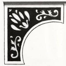
Gambar 9. Ornamen dan Bentuk Geometris Sumber: Dokumentasi Pribadi (2024)