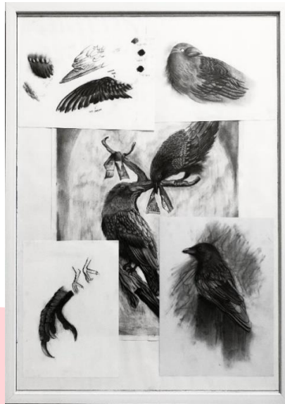
Gambar 3. Proses Berkarya

Proses berkarya dengan menggunakan charcoal dan menggambar gagak ini juga merupakan bentuk dari terapi penulis dalam mengurangi tingkat kecemasan dan ketakutan yang dialami