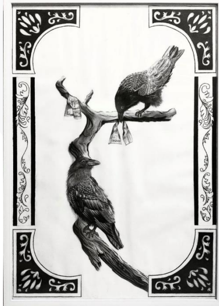
Gambar 15. Hasil Karya (A1 59,4 x 84,1)