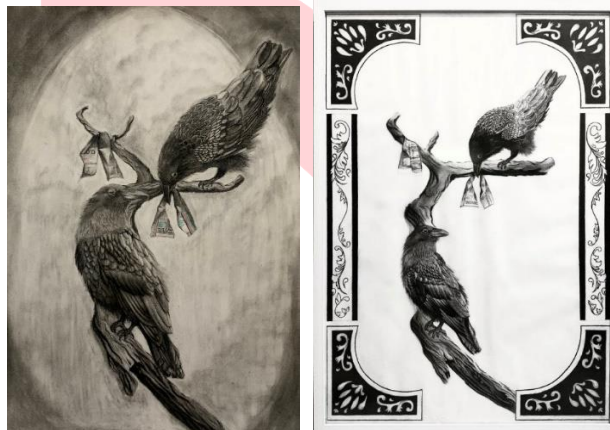
Gambar 16. Progres Perkembangan Terapi Seni Dengan Charcoal Dengan Bentuk Geometris

Visualisasi karya yang bersumber dari ide kecemasan, ketakutan akan kematian serta masalah tidur yang dialami penulis dihadirkan dalam bentuk karya drawing charcoal dengan menggunakan objek visual gagak sebagai representasi kematian, obat clozapine atau obat tidur merepresentasikan gangguan tidur dan obat kalxetin atau obat antidepresan yang merepresentasikan adanya gangguan kecemasan dan ketakutan. Proses berkarya dengan menggunakan charcoal ini penulis gunakan sebagai terapi seni yang benar – benar membantu penulis dalam mengurangi tingkat kecemasan dan ketakutan yang dialami penulis.