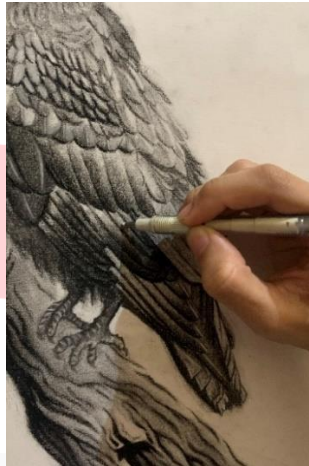
Gambar 3. 1 Proses Membuat Highlight

Langkah selanjutnya ialah membuat highlight , dengan cara memakai penghapus dan white charcoal . Penghapus dapat digunakan untuk menghapus daerah yang ingin dijadikan highlight dan white charcoal dapat membuat daerah highlight terlihat lebih terang