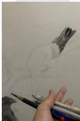
Gambar 12. Proses Membuat Gradasi

Pada tahap ini penulis menggunakan teknik blending agar warna yang diciptakan dari charcoal lebih merata dan menciptakan efek gradasi, teknik ini dapat dilakukan dengan cara digosok dengan paper stump dan juga dapat menggunakan white charcoal agar gradasi dari charcoal hitam terlihat lebih halus.