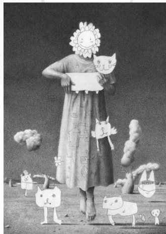
Gambar 1 "Mother and Cat", Garis Edelweiss (2021)

Contoh karya seperti mother and cat juga merupakan hasil kolaborasi dengan anak nya yang berumur 5 tahun. Kondisi pandemi yang mengharuskan ia meluangkan banyak waktu dirumah dengan keluarga membawa nya pada kegiatan seni yang menyenangkan dan juga menjadi terapi.