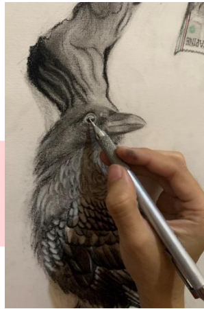
Gambar 14. Finishing Karya

Setelah tahap – tahap diatas selesai, selanjutnya melakukan finishing karya dengan memastikan lagi jika ada bagian yang kurang, perlu diperbaiki dan melakukan varnish dengan fixative spray agar debu charcoal tidak menimbulkan noda.