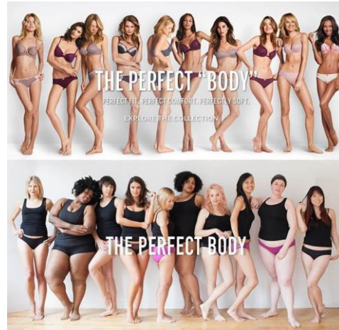
Gambar 1. 1 Body Positivity

bahwa seseorang yang terekspos gambar-gambar seleb yang memiliki tubuh ideal di media sosial mengalami masalah hilangnya rasa percaya diri dan mempunyai citra tubuh yang kurang baik seperti rasa ketidakpuasan terhadap tubuh yang dimilikinya.