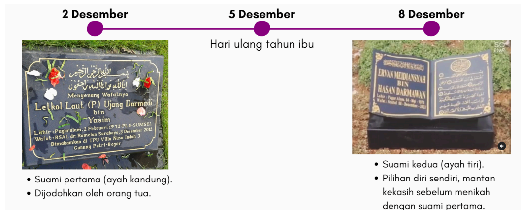
Gambar 1. Makam kedua ayah penulis.

dalam masyarakat sering diperlakukan sebagai “jenis kelamin kedua” ( the second sex ) karena mereka sering diidentifikasi oleh hubungan dengan laki-laki. Hal ini dapat diterapkan pada janda yang sering kali didefinisikan oleh status pernikahan atau hubungan dengan pasangan mereka yang telah meninggal.