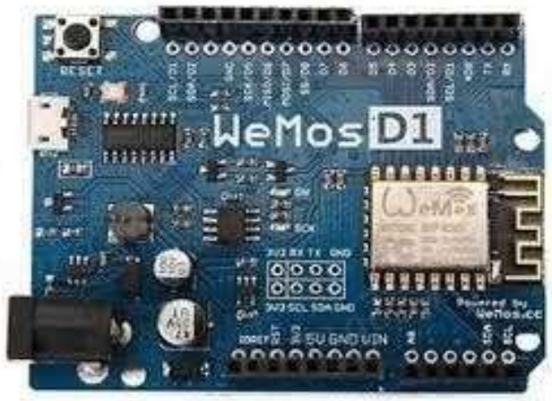
Gambar 2 1 Wemos D1 R2

Berikut adalah Spesifikasi Pin I/O pada Wemos D1 R2: