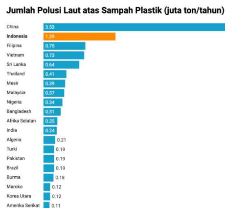
Gambar 1. 2 Jumlah polusi laut atas sampah plastik (juta ton/tahun) menurut Jenna Jambeck [9]

Pada Gambar 1.1 menunjukkan bahwa sampah botol plastik dapat terurai 450 tahun, sedangkan Pada tahun 2016, sekitar 480 miliar botol plastik terjual di seluruh dunia, atau sekitar satu juta botol plastik per menit [3].