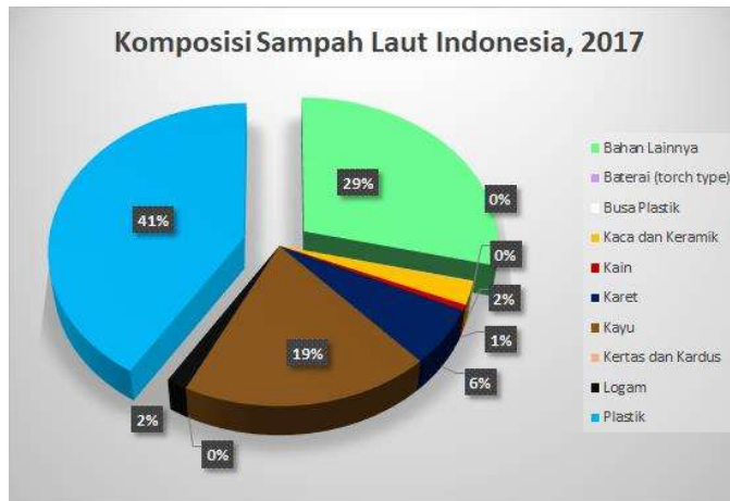
Gambar 1. 3 Jumlah Komposisi Sampah Laut Indonesia tahunan 2017 [10]

Menurut Jenna Jambeck, Indonesia merupakan penghasil sampah plastik terbesar kedua di dunia setelah China tertera pada gambar 1.2[9]. Pada gambar 1.3 menjelaskan bahwa sampah plastik terbanyak dari sampah lainnya. Polusi plastik diperkirakan akan terus meningkat di Indonesia. Saat ini, industri minuman di Indonesia merupakan salah satu industri dengan pertumbuhan tercepat. Pertumbuhan industri pengolahan minuman sebesar 24,2% pada 2019 [10]. Dengan demikian, RVM ini merupakan sebuah inovasi yang dapat menyelesaikan masalah yang terjadi pada pengelolaan sampah plastik botol saat ini yang masih dilakukan secara manual, dan tidak efisien. Sehingga pembuatan RVM ini dapat mengatasi batasan-batasan masalah dari RVM yang pernah dibuat sebelumnya dengan diberikannya kelebihan-kelebihan seperti fitur reward poin berhadiah, terintegrasi dengan sistem IoT, informasi user RVM yang dapat di pantau di mana pun dengan user melalui website , dan dapat menghasilkan hasil cacahan yang dapat di daur ulang.