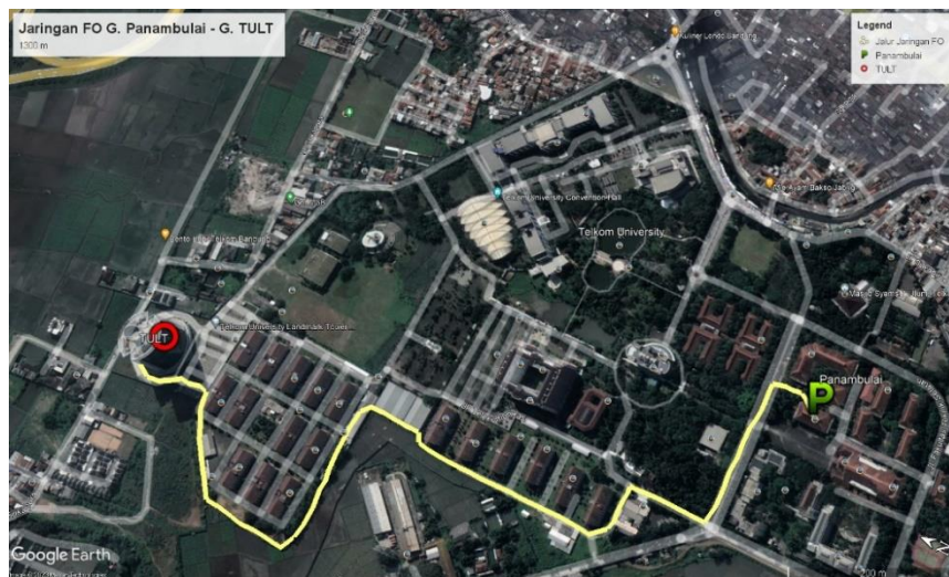
Gambar 1.2 Jalur jaringan FO.

1 dan disebar ke setiap lantai dengan menggunakan media serat optik hingga ke access switch , selanjutnya jaringan disebar ke setiap access point dengan menggunakan kabel Unshield Twisted Pair (UTP) cat 6. Untuk jalur jaringan distribusi FO dari server menuju gedung TULT dapat di lihat pada Gambar 1.2. Kabel distribusi FO tidak ditanam kedalam tanah akan tetapi menggunakan jalur parit yang melalui gedung P dan asrama mahasiswa baru lalu berakhir di ODC gedung TULT yang terdapat di basement .