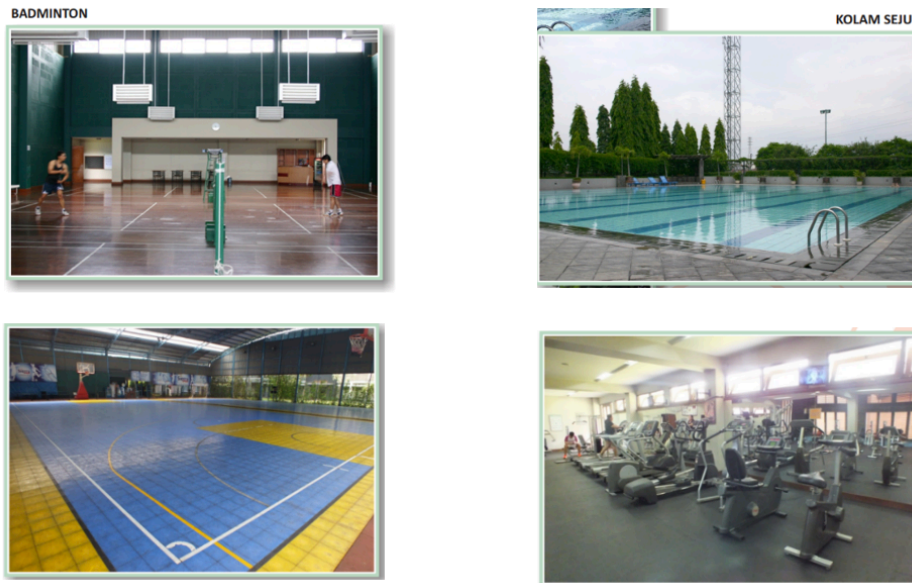
Gambar I.1 Fasilitas Batununggal Indah Club

Meskipun telah menyediakan fasilitas olahraga yang lengkap, pusat olahraga seperti Batununggal Indah Club seharusnya tidak hanya fokus pada aspek penyediaan fasilitas olahraga saja. Lebih dari itu, kualitas layanan kepada pelanggan menjadi elemen penting dalam memastikan kepuasan mereka (Saipuloh & Surono, 2023). Memberikan pengalaman terbaik bagi pelanggan merupakan hal yang sangat penting. Dalam hal ini, diperlukan penyusunan strategi yang dapat membawa hasil, tidak hanya untuk menciptakan, melainkan juga menyajikan dengan jelas serta mengkomunikasikan nilai atau layanan utama yang ditawarkan (Junaris & Haryanti, 2022). Tujuannya adalah agar sesuai dengan kebutuhan pasar dan mampu membedakan diri dari pesaing lainnya. Selain itu, pemeliharaan prasarana juga merupakan hal penting dalam situasi ini. Perawatan sarana prasarana merupakan suatu kegiatan pemeliharaan berkelanjutan yang menjaga agar setiap jenis fasilitas sarana prasarana tetap dalam kondisi baik dan siap pakai (Suciana & Suraya, 2022). Tujuan pengelolaan sarana dan prasarana olahraga agar dapat bertahan lama dan aman serta dapat digunakan dengan baik sesuai fungsinya.