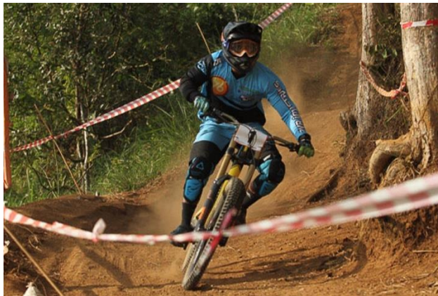
Gambar I. 1 Pembalap downhill manuver belok

Selain menjadi pilihan alternatif untuk berkendara, sepeda juga dapat menjadi alat untuk berolahraga. Bersepeda adalah olahraga paling populer karena dapat dilakukan oleh siapa saja, bahkan mereka yang obesitas (Khuddus, 2020). Dalam perkembangannya, sepeda memiliki berbagai jenis mulai dari sepeda hybrid , sepeda lipat, sepeda BMX, sepeda Mountain Bike (MTB) sepeda downhill , sepeda anak-anak, dan lain-lain. Beberapa jenis sepeda dibuat khusus karena dirancang untuk mampu melewati trek (lintasan) yang ekstrem salah satunya adalah sepeda MTB downhill .