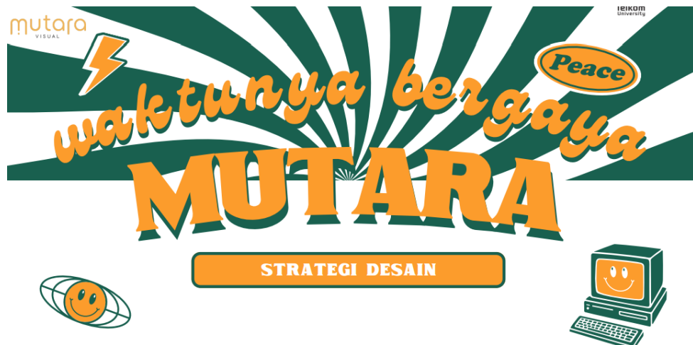
Gambar 1. 1 Logo Perusahaan

Mutara Visual merupakan usaha yang bergerak dibidang penyedia jasa foto dan cetak yang berlokasi di komplek Sapta taruna PU Blok B, No. 141, Kec. Bandung Kidul, Kota Bandung, Jawa Barat. Visi dari Mutara Visual adalah “we provide a memorable photo experience” yang berarti kami memberikan pengalaman foto yang mengesankan. Misi dari Perusahaan Mutara Visual adalah menyediakan jasa foto yang berkualitas tinggi, dengan harga terjangkau di pasaran sehingga dapat digunakan siapapun, kapanpun, dimanapun dan mengutamakan kualitas produk dan pelayanan untuk kepuasan konsumen. Target pasar UMKM Mutara Visual ini khususnya untuk seluruh warga Kota Bandung dan umumnya bagi semua kota yang ada di Jawa Barat dan sekitarnya. Dengan menggunakan ads dan media promosi lainnya di sosial media. Mutara Visual juga berkeinginan untuk sering berkolaborasi antar acara wedding dengan sistem sharing profit . Segmen sasarannya yaitu orang-orang dewasa yang berkeinginan memeriahkan acaranya dengan mengabadikan momen dengan sesuatu hal yang baru. Mutara Visual sendiri memiliki 2 tipe, yaitu Mirror Photobooth dan 360 Videobooth . Harga dari jasa Mutara visual untuk mirror photobooth adalah sebagai berikut: