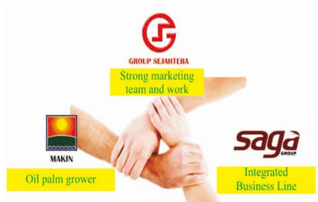
Gambar 1.1 Lini Bisnis PT. Hanampi Sejahtera Kahuripan

Gambar 1.1 di bawah ini menunjukkan lini bisnis PT. Hanampi Sejahtera Kahuripan: