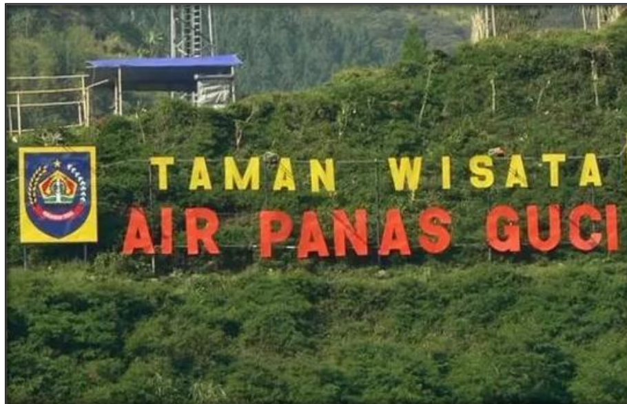
Gambar 1. 2