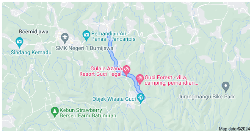
Gambar 1. 1

Luas wilayah Wisata Guci sekitar 167.44 Ha yang terdiri dari hutan (terluas), permukiman, semak-semak, lahan pertanian, dan lahan ladang. Bagian permukiman warga juga digunakan untuk tempat penginapan hotel, pondok, dan villa yang berada di sekitar kawasan objek wisata.