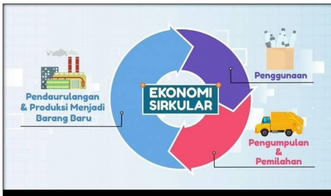
Gambar 1. 4