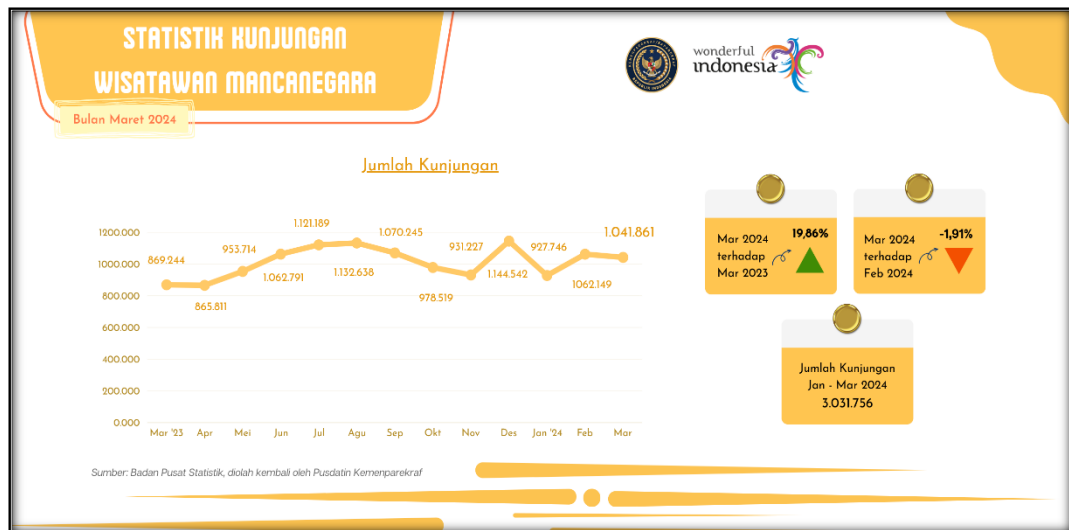
Gambar 1. 3