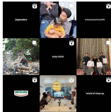
Gambar 1.1 Konten Akun Instagram @pandawaragroup

Pandawara Group memiliki tampilan konten yang lebih sederhana dibandingkan dua organisasi sebelumnya. Pengikut yang dimiliki di akun media sosial Instagram @pandawaragroup sendiri mencapai 2,4 juta. Berbeda dengan kedua organisasi sebelumnya, Pandawara Group tidak hanya berfokus kepada kampanye dan edukasi melainkan aktivitas atau kegiatan terjun langsung untuk menanggulangi dan mengurangi kerusakan lingkungan. Salah satunya adalah dengan membersihkan sungai dari tumpukan sampah.