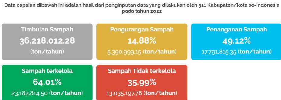
Gambar 1.2 Data Timbulan Sampah Tahun 2022

Volume sampah terus meningkat meskipun sistem pengelolaan sampah hingga saat ini ada peningkatan dan perbaikan, akibatnya masalah sampah menjadi lebih kompleks. Keberadaan sampah tidak dapat dihindari karena adanya sifat konsumtif masyarakat yang tidak terbatas (Shadiq, 2023). Sampah menjadi permasalahan yang tak kunjung teratasi di Indonesia, dapat dilihat pada gambar di bawah ini yang menunjukkan mengenai data jumlah sampah yang terdiri dari timbulan, pengurangan, penanganan, terkelola, dan tidak terkelola.