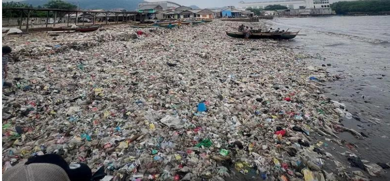
Gambar 1.1 Tumpukan Sampah di Pinggir Pantai di Lampung