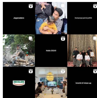
Gambar 1.5 Konten Akun Instagram @pandawaragroup

Pandawara Group memiliki tampilan konten yang lebih sederhana dibandingkan dua organisasi sebelumnya. Pengikut yang dimiliki di akun media sosial Instagram @pandawaragroup sendiri mencapai 2,4 juta. Berbeda dengan kedua organisasi sebelumnya, Pandawara Group tidak hanya berfokus kepada kampanye dan edukasi melainkan aktivitas atau kegiatan terjun langsung untuk menanggulangi dan mengurangi kerusakan lingkungan. Salah satunya adalah dengan membersihkan sungai dari tumpukan sampah.