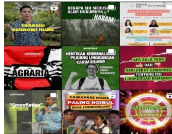
Gambar 1.4 Konten Akun Instagram @greenpeaceid

Organisasi selanjutnya adalah Greenpeace Indonesia yang didirikan pada tahun 2005 yang merupakan salah satu kantor regional yang dimiliki oleh Greenpeace sebagai organisasi internasional yang berkampanye di sektor lingkungan hidup secara global yang kantor pusatnya bertempat di Amsterdam, Belanda. Jumlah pengikut dalam media sosial Instagram @greenpeaceid berjumlah 729 ribu pengikut.