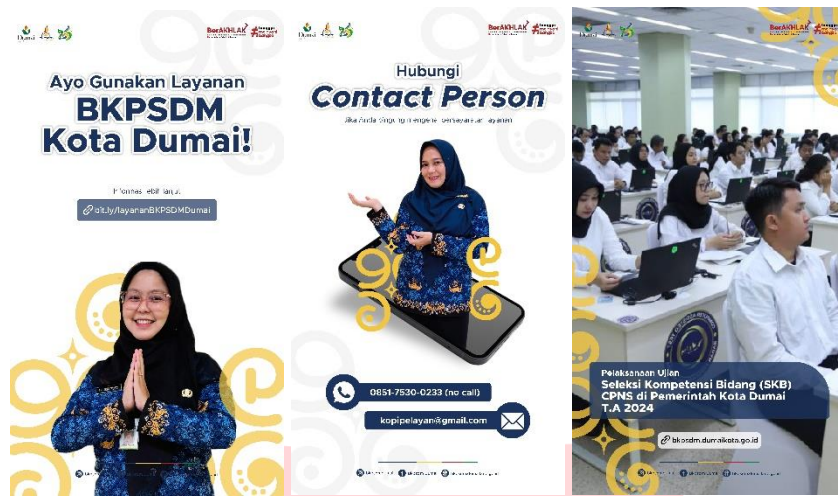
Gambar 4 Instagram Story