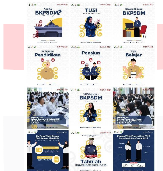
Gambar 3 Instagram Feeds

Konten feeds to inform mencakup beberapa informasi yaitu pengenalan, detail, alur, persyaratan dari layanan yang disediakan dan informasi seputar kegiatan kepegawaian di BKPSDM Kota Dumai. Kemudian konten to persuade terdapat pada ajakan yang ada pada konten feeds .