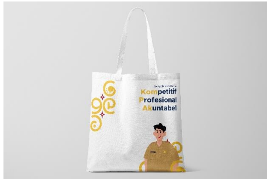
Gambar 8 Totebag