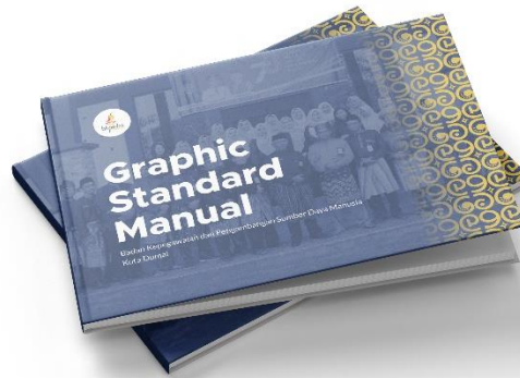
Gambar 1 Graphic Standard Manual