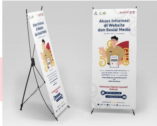
Gambar 6 X-Banner

X-banner dan spanduk ini memiliki tujuan untuk menginformasi dan membujuk para ASN yang datang ke kantor untuk mengakses website/sosial media untuk pencarian informasinya.