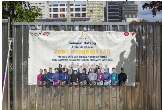
Gambar 7 Spanduk