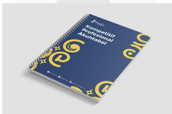
Gambar 10 Notebook