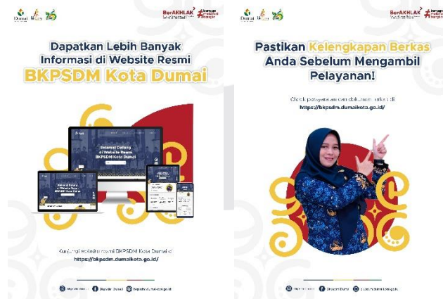
Gambar 5 Poster Digital Sumber: Andriyani, Lukito, Prajana

Poster digital digunakan untuk memberi, mengingatkan, dan mengajak audiens di dalam maupun diluar sosial media. Poster digital dapat berisi layanan, kontak, berita dengan pencantuman link website.