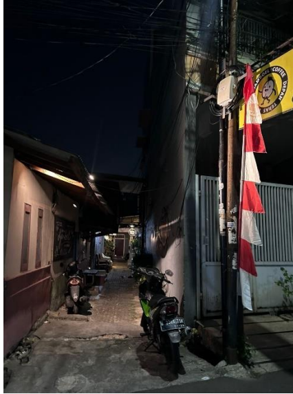
Gambar 1.5 Lokasi di Depan Gang Djamboel Coffee