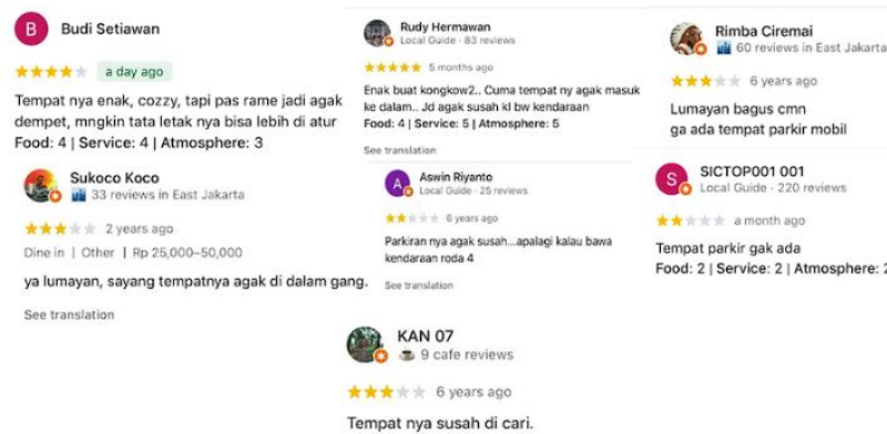
Gambar 1.4 Ulasan Mengenai Lokasi & Physical Evidence di Djamboel Coffee

dilakukan penelitian lebih lanjut untuk dapat mengetahui bahwa kedua variabel tersebut berpengaruh kepada keputusan pembelian.