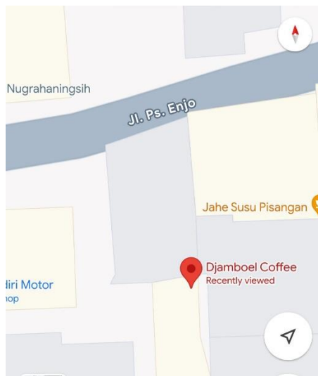
Gambar 1.6 Posisi Djamboel Coffee Dilihat dari Google Maps