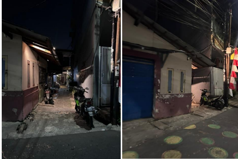
Gambar 1.7 Tempat Parkir di Djamboel Coffee