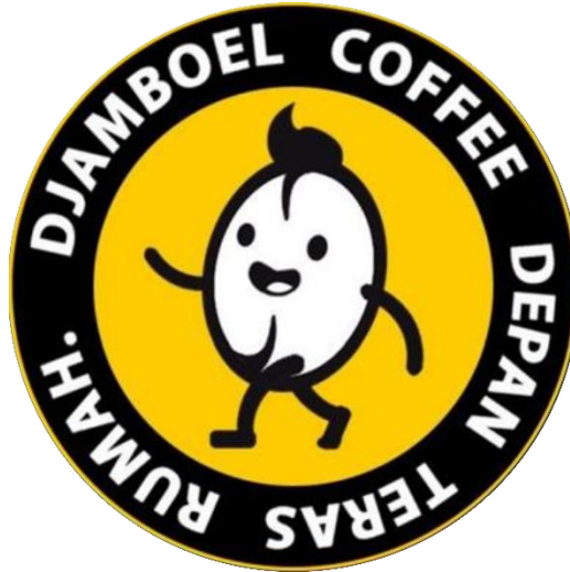
Gambar 1.1 Logo Djamboel Coffee