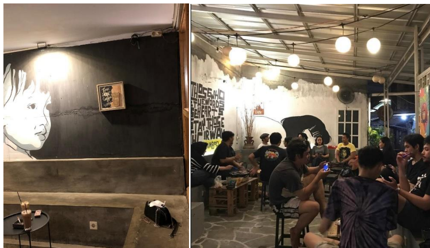
Gambar 1.8 Ruang Indoor & Outdoor di Djamboel Coffee