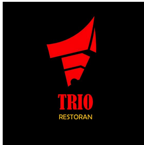
Gambar 1. 1 Logo Restoran Trio

Restoran Trio , yang berlokasi di Jl.Raya Padjajaran No. 221, Bantarjati, Kota Bogor, Indonesia, adalah restoran khas Padang yang berdiri sejak tahun 1993. Didirikan oleh keluarga asli Padang Panjang, restoran ini bermula dari sebuah rumah makan kecil dan kini telah tersebar dengan berbagai cabang di sejumlah kota besar di Indonesia. Restoran Trio berkomitmen untuk menyediakan hidangan khas Padang yang autentik dengan bahan-bahan berkualitas tinggi, memberikan pengalaman bersantap yang menyenangkan, dan melestarikan budaya kuliner Padang Panjang.