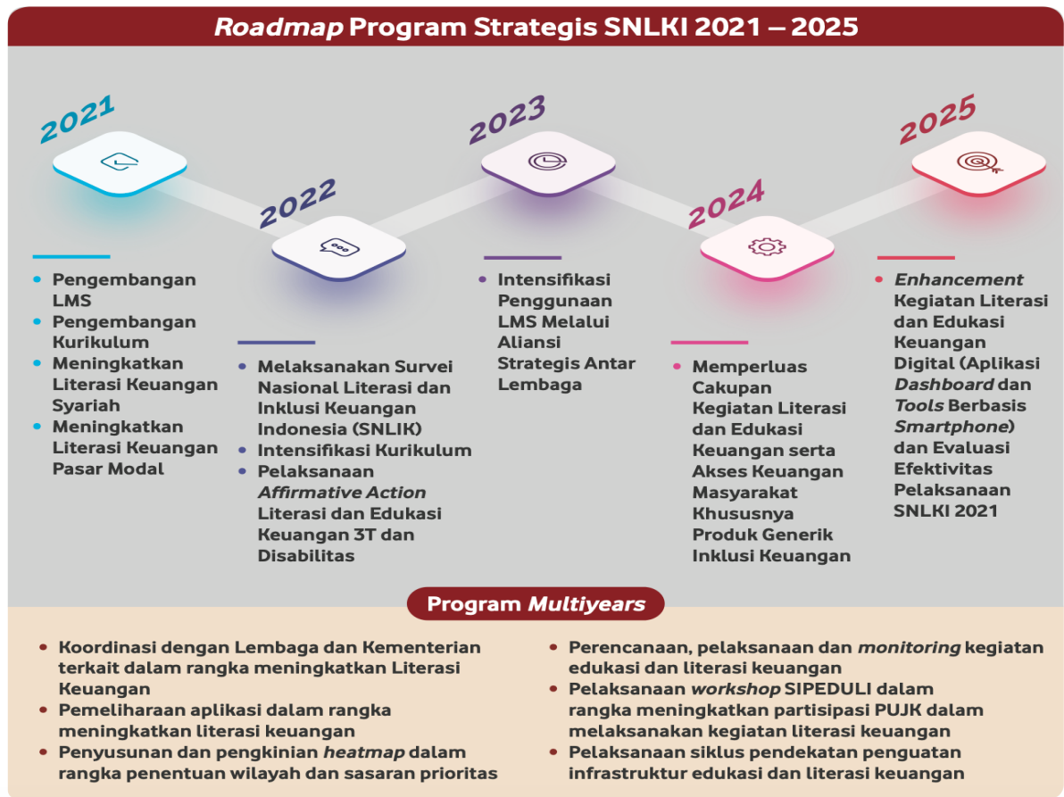
Gambar 1.2 Roadmap Program Strategis SNLKI 2021 – 2023

OJK telah membuat Roadmap strategis dalam rangka peningkatan inklusi dan literasi keuangan, dalam roadmap ini dapat kita lihat bahwa dengan banyaknya program yang ada dapat diartikan bahwa financial literacy merupakan pengetahuan yang penting yang harus diketahui oleh Masyarakat. pengelolaan keuangan yang baik diharapkan mampu menjadi jembatan bagi masyarakat agar mampu memiliki kehidupan yang baik dimasa yang akan datang.