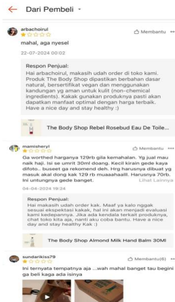
Gambar 1. 5 Review Buruk Harga Produk The Body Shop