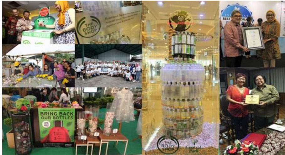
Gambar 1. 1 Kampanye #KerenTanpaNyampah

yang berfokus pada lingkungan, serta menarik perhatian konsumen yang menghargai produk yang ramah lingkungan.